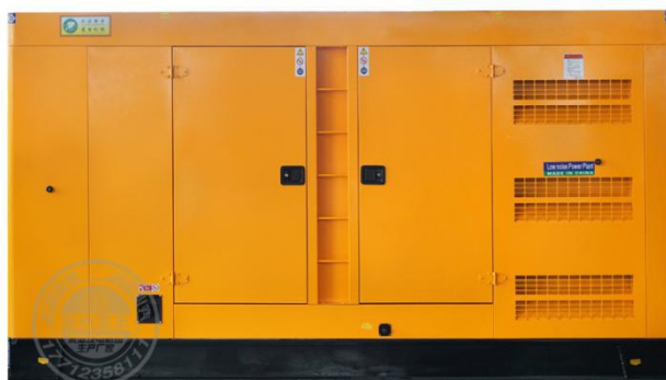
静音型机组（需选装）