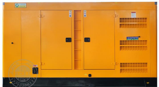
静音型机组 (需选装)